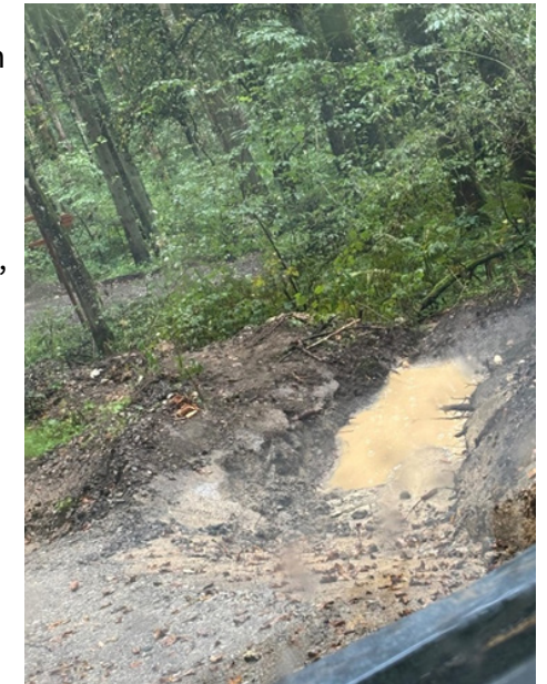
Klimatümpel: Das Wasser bleibt im Wald