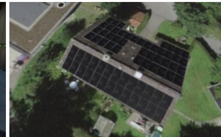
PV Anlage ist geplant