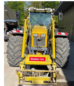
Der neue bodenschonende Rigitrac