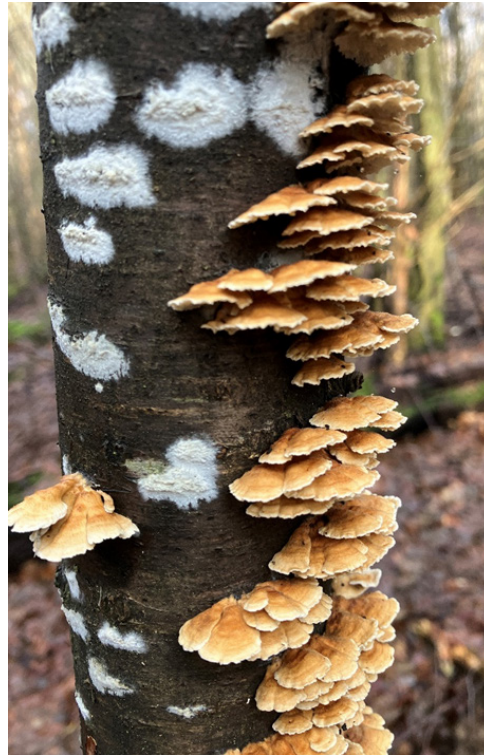
Einziger Schatz: Baumpilze