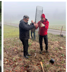
Der Speierling ist eine seltene Baumart und wird hier gezielt gepflanzt