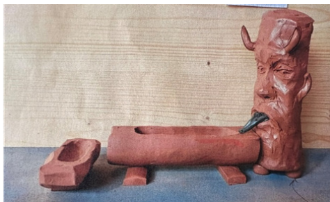
So könnte er aussehen: Teufelsbrunnen bei der Herzoghütte